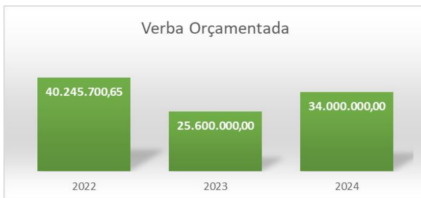
Gráfico n.º 2 – Evolução da verba global orçamentada de 2022 a 2024

Os gráficos que se seguem, para uma visão mais clara, demonstram a perspetiva evolutiva ao longo de 2022 a 2024