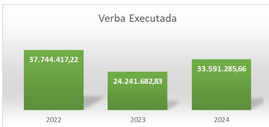
Gráfico n.º 3 – Evolução da verba global executada de 2022 a 2024

No que diz respeito à verba executada, o ano de 2022 foi o que obteve montante mais elevado em comparação com os anos em referência. Como já foi referido, houve um reforço de verbas muito considerável para o ISS, I.P., verificando-se uma queda nos valores apresentados, quase para metade, em comparação ao ano de 2023. Em 2024 existiu de novo um reforço de verbas para todas as entidades financiadoras, observando-se, de novo, um aumento da verba executada.