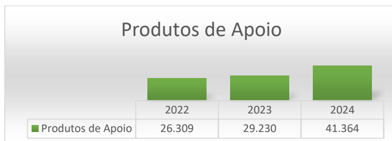
Gráfico n.º 5 – Evolução do número global de Produtos de Apoio atribuídos de 2022 a 2024

No que diz respeito à atribuição de produtos de apoio através do SAPA, verifica-se um valor exponencial na sua atribuição no ano de 2024. Neste ano quase duplicaram os produtos atribuídos em relação aos anos anteriores. Também nesta variável, o ano de 2022, com uma verba de valor mais elevado, não corresponde ao maior número de produtos de apoio atribuídos tendo-se verificado essa situação no ano em apreço (2024).