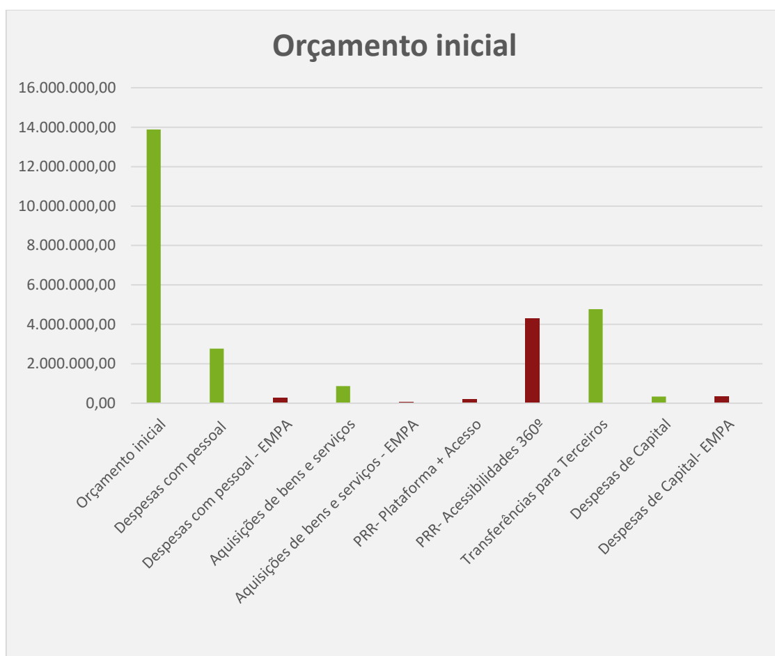
Figura 2 - Orçamento Inicial

Da análise da Tabela 1 e Figura 2, releva-se o predomínio das Transferências para Terceiros em duas vertentes, uma (34,35%) de onde se destaca o apoio financeiro a Projetos e ao Funcionamento de ONGPD. Nesta percentagem inclui-se ainda, apoios financeiros no âmbito dos Contratos-Programa de Desenvolvimento Desportivos celebrados com variadas Federações